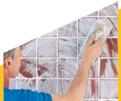
Trải vữa bằng bàn xoa cao su