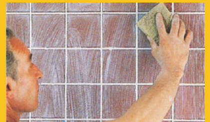
Vệ sinh sử dụng miếng bọt biển